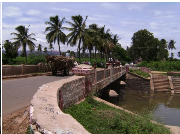
Abbildung 2: Indien ländlich