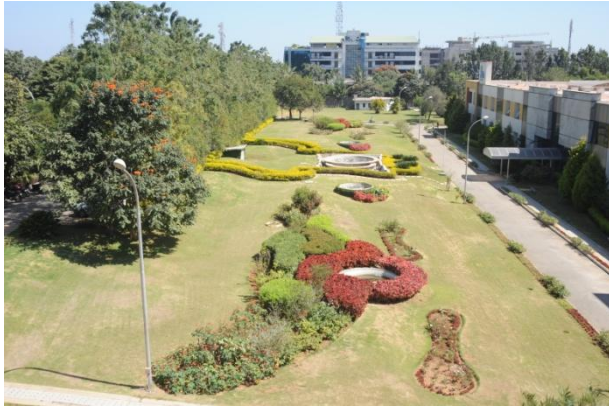
Abbildung 9: Vogelperspektive, Grünanlage Vorderseite