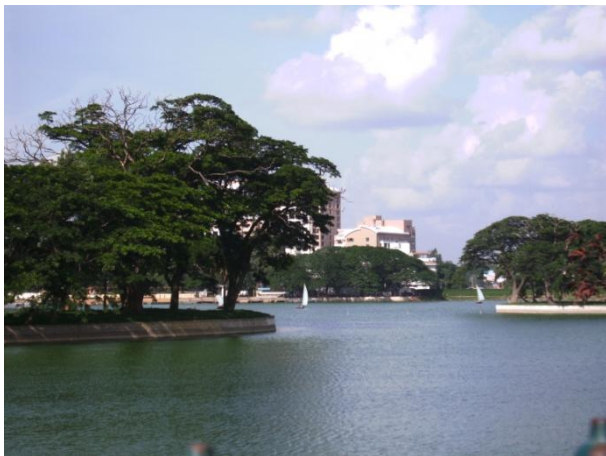
Abbildung 11: Ulsoor Lake (Bangalore)

In der Zeit, die man in Bangalore verbringt sollte man auf jeden Fall einige der wirklich interessanten Sehenswürdigkeiten besuchen. Dazu zählt der „Tippu Sultan Palace“, der ein sehr schöner und auch gut erhaltener Palast eines ehemaligen Herrschers ist. Auch ein hinduistischer Tempel namens „Bull Temple“ sollte in Augenschein genommen werden. Im Innern befindet sich ein riesiger Stier aus Stein. Dies ist einer der prächtigsten Tempel in Bangalore. Aber auch ruhigere Plätze mit mehr Natur sind in Bangalore zu finden. Dazu zählt der Botanische Garten „Lal Bagh“, der mit vielen fremdartigen Pflanzen und Bäumen geschmückt ist. Auch ein wunderschöner See mit Booten befindet sich mitten in der Großstadt. Der „Ulsoor Lake“ liegt umschlossen von großen Gebäuden und ist ein kleines Paradies in der Stadt. Sollte auch die Zeit vorhanden sein, sich etwas von Bangalore wegzubewegen, bieten sich die „Nandi Hills“ für einen Wanderausflug an. Hier kann man beim Wandern noch einige bekannte Tempel besichtigen.