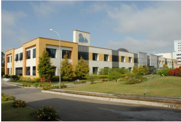
Abbildung 3: Sicht vom Haupttor auf das IIITB