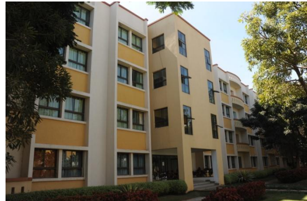
Abbildung 8: Wohnheim

Auf dem Universitätsgelände befinden sich drei Wohnheime. Hierbei sind zwei der Gebäude für Männer und eines für Frauen. Alle Gebäude haben vier Stockwerke und wurden erst kürzlich mit einem Fahrstuhl ausgestattet. Hier gibt es drei verschiedenen Kategorien von Zimmern. Die kleinsten Zimmer haben nicht mehr als ein Bett, einen Schreibtisch, einen Stuhl, einen Schrank und einen Deckenventilator. Das Badezimmer mit den Duschen, Waschbecken und Toiletten ist am Ende eines Flures und wird von den Studenten gemeinsam genutzt. Etwas besser ausgestattete Zimmer gibt es ebenfalls. Diese sind meist den Austauschstudenten und Lehrern vorbehalten. Dabei sind die Räume größer und besitzen ein eigenes Badezimmer mit Dusche, Waschbecken und westlicher Toilette. In solch einem Zimmer war ich während meines Aufenthaltes am IITB. Dieses Zimmer besitzt alles, was man in der Studienzeit benötigt und ich fühlte mich dort sehr wohl. Das Zimmer lag im dritten Stock, was wiederum Vorteile im Bezug auf Tiere mit sich brachte. So zählten zu den wenigen Tieren, die über diese Zeit im Zimmer waren Moskitos, wenige Geckos und auch nur sehr wenige Kakerlaken, die vom Abendlicht angezogen wurden. Auch eine weitere Kategorie der Zimmer gibt es in den Wohnheimen, jedoch waren diese den Professoren vorbehalten. Die Gemeinschaftsräume sind mit Fernsehern ausgerüstet und können jederzeit genutzt werden.