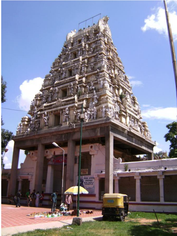
Abbildung 13: Bull Tempel (Bangalore)