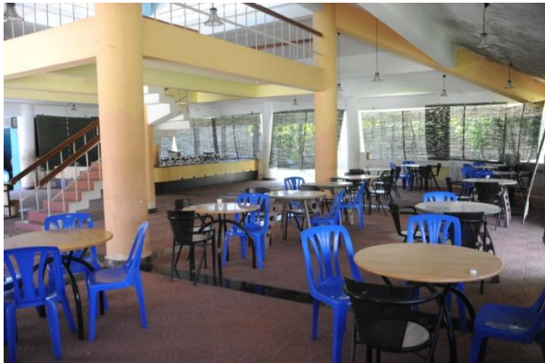
Abbildung 7: Kantine

die nicht so scharfen Gerichte zu wählen. Auch das Essen wie Sandwiches und anderes sollte immer nicht scharf bestellt werden. An das scharfe Essen gewöhnt man sich jedoch sehr schnell, besonders wenn man alle Essen ausprobiert.