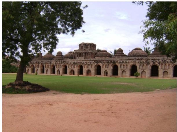
Abbildung 12: Elefantentempel (Hampi)