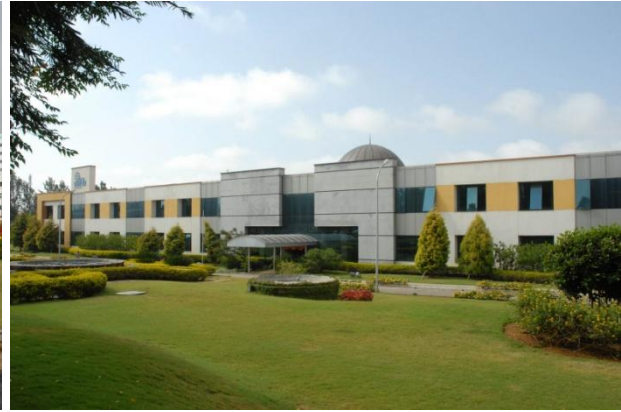
Abbildung 4: Sicht vom Nebentor auf das IIITB

Die Universität liegt im Zentrum der Electronic City und man findet im direkten Umkreis Firmen wie Infosys, Siemens, HP u.v.m..