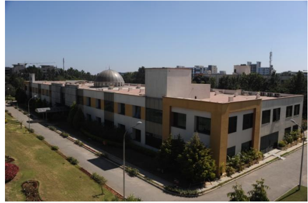
Abbildung 10: Vogelperspektive, Vorderseite des IIITB

Auch an Plätzen für sportliche Aktivitäten mangelt es nicht. So verfügt jedes Wohnheim über Tischtennisplatten und ein Fitnessstudio, die für jeden Studenten zur freien Verfügung stehen. Sport kann auch an der freien Luft betrieben werden. So ist direkt neben der Kantine ein Volleyballfeld, das gerne zu später Nachmittagsstunde genutzt wird. Auch zwei Spielfelder für Badminton sind auf dem Gelände und werden besonders nachts von den Studenten aufgesucht, da hier die Temperaturen weitaus niedriger sind. Dieser Platz ist selbstverständlich beleuchtet und kann daher auch im Dunkeln genutzt werden. Aber auch das Nationalspiel Cricket kommt auf dem Campus nicht zu kurz und wird regelmäßig zwischen den Studenten betrieben. Hierbei wird man nach kurzer Zeit des Zuschauens von den Kommilitonen zum Mitspielen eingeladen.