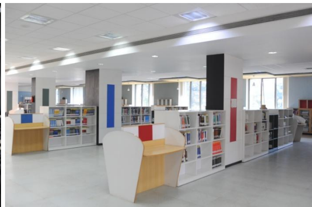
Abbildung 6: Bibliothek

Verpflegung ist ebenfalls fast rund um die Uhr zu erhalten. Es gibt eine Kantine, die morgens um sieben Uhr öffnet und abends um 24 Uhr schließt. Nudeln, Sandwichs, Kaffee, Tee und anderes kann hier fast die ganze Zeit bestellt werden. Des Weiteren wird Frühstück, Mittagessen und Abendessen von außerhalb angeliefert. In dieser Zeit ist auch nur dieses Essen verfügbar und es kann kein gesondertes Essen oder Trinken bestellt werden. Morgens ist dies von sieben bis neun, mittags von 13 bis 14 und abends von 20 bis 22 Uhr der Fall. Der Preis für ein solches Essen beträgt umgerechnet nicht mehr als einen Euro. Zu Beginn gebietet es sich, auf die indischen Kommilitonen zu hören und