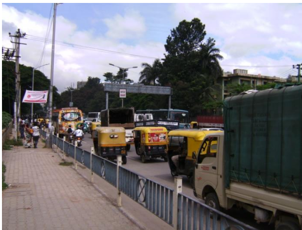
Abbildung 1: Silk Board (Bangalore)

Auch wer gerne einkaufen geht, kommt in dieser Stadt nicht zu kurz. Die Stadt besitzt zahlreiche Einkaufszentren, die alle mehr als genug Auswahl bieten. Hier empfiehlt es sich, einige Sachen einzukaufen, da die Preise sehr günstig sind. Auch kann man sich hier leichtere und dünnere Kleidungsstücke kaufen, die man hier dankbar trägt.